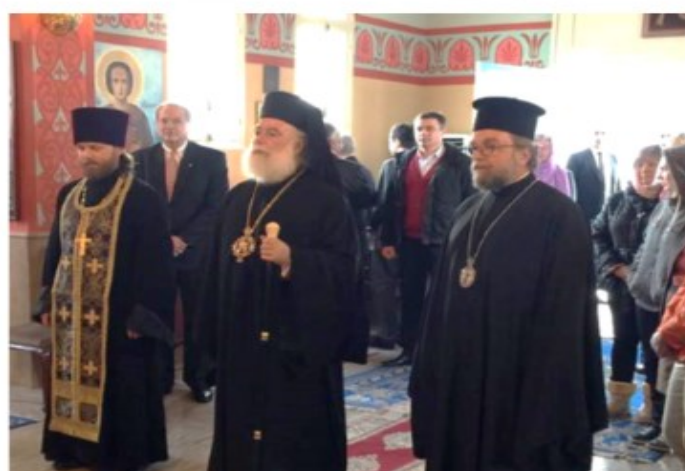
Посещение на Александрийския патриарх Теодор в църквата „Възкресение Христово“, гр. Рабат, 23 март 2015 г.

на и камбанарията. През 1933 г. към храма е учреден и благотворителен комитет, който да подпомага